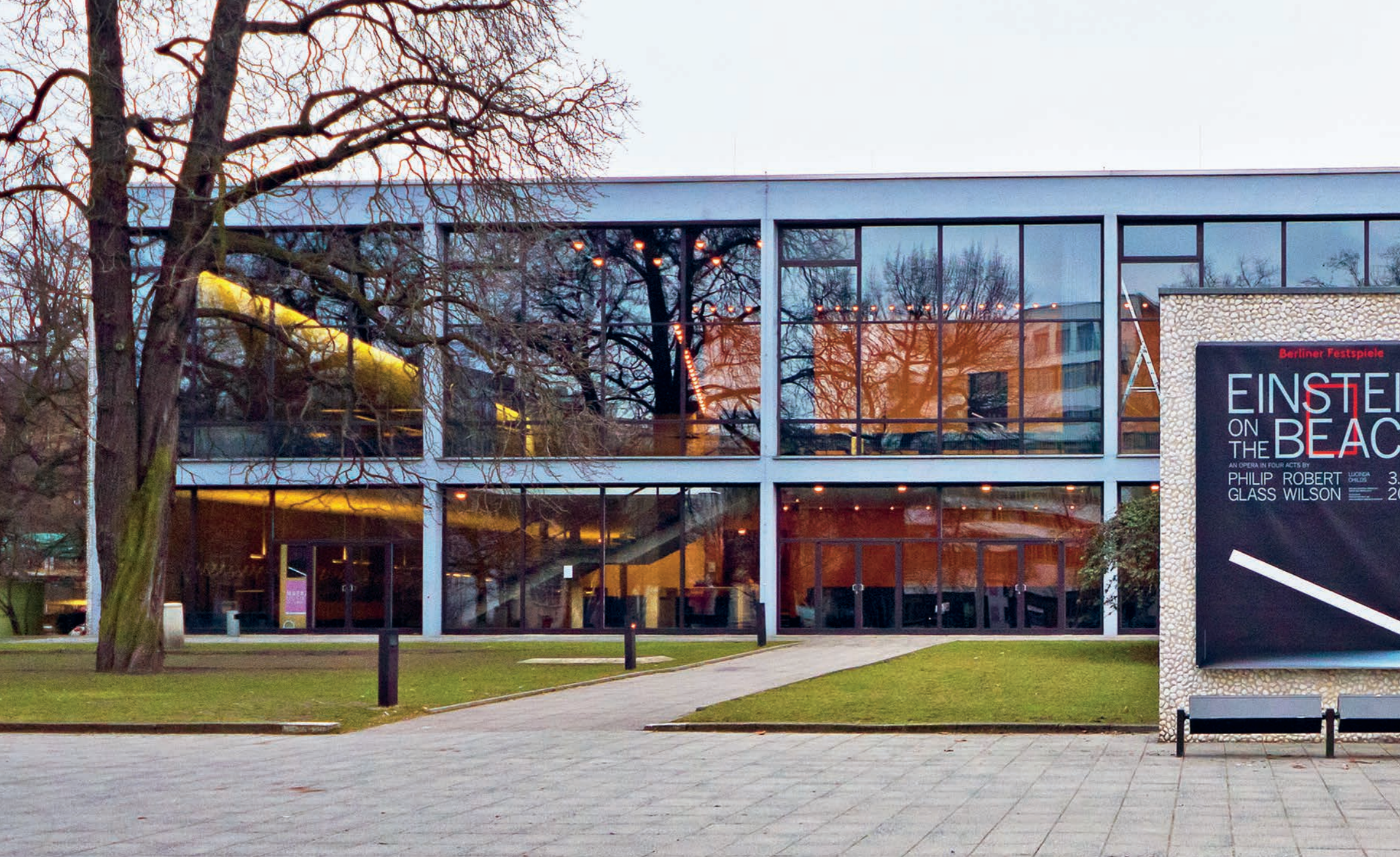
Haus der Berliner Festspiele, Berlin