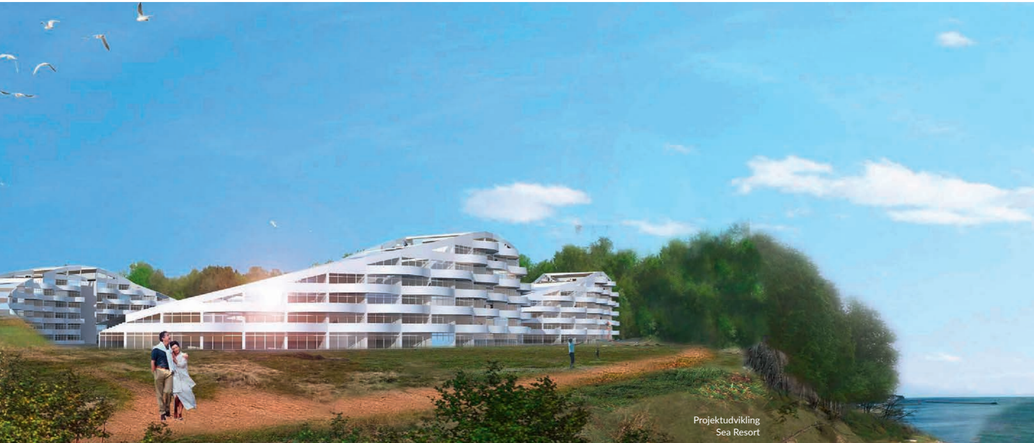
Projektudvikling Sea Resort