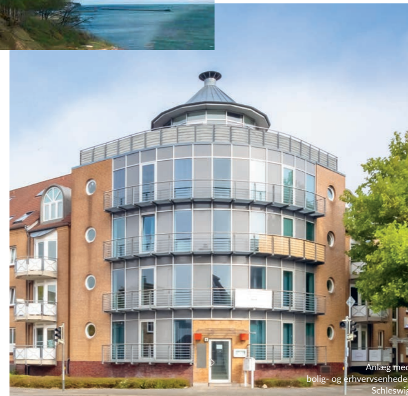
Anlæg med bolig- og erhvervsenheder Schleswig

Uanset, om det gælder finansieringen af en ny ejendom eller omlægningen af dit lån i en eksisterende ejendom, yder vi kompetent rådgivning under hele processen, når du skal finde det rette lån.